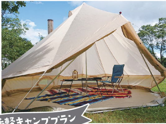
お手軽キャンププラン