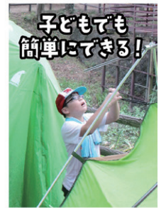
子どもでも簡単にできる!