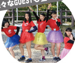
野活祭のアイドル!? YKT48