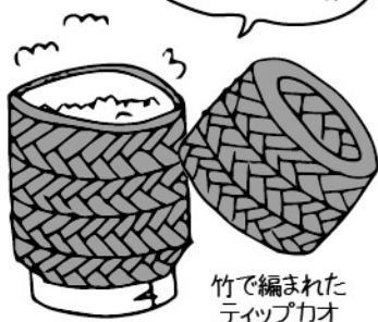
竹で編まれた ティップカオ

東南アジアのタイやラオスでは、もち米が主食として食べられています。ラオスではもち米は「カオニャオ」と呼ばれ、竹でできた容器「ティップカオ」の中に炊きあがったもち米を入れ、左手で握って丸め、オカズや汁物につけて食べるそうです！