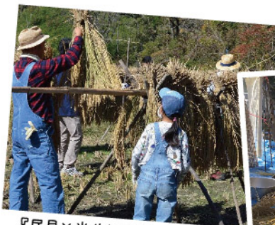
『民具×米作り体験』の様子

キャンピイだいとうでは、おとな・ファミリー向け事業として大東市歴史民俗資料館からお借りした貴重な民具を使用し、半年かけてお米を作って食べる『民具×米作り体験』を毎年開催しています。そんな米作り体験で、今年はおもち米作りにもチャレンジし18kgのおもち米が収穫されました！今回はそんなおもち米のひみつに迫っていきますよー！