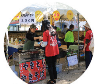
協力団体模擬店ブース ありがとうございます!