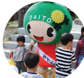
大東市のご当地キャラ ダイトン!