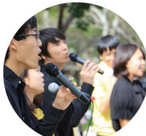
奈良教育大学 アカペラ部奈響ネブの皆さん