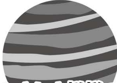
しましま模様の 木星さん

3月から9月ごろまで太陽が沈んだ後、西の空に輝いている一番星が金星です。夕方が明け方にしか見えませんが、ひと月に1度、月と金星が並んで見えることがありとても幻想的です。