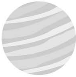
輝け1番星! 金星さん

3月から9月ごろまで太陽が沈んだ後、西の空に輝いている一番星が金星です。夕方が明け方にしか見えませんが、ひと月に1度、月と金星が並んで見えることがありとても幻想的です。